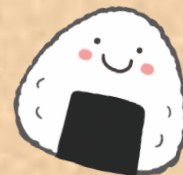
運動会・ お面づくり