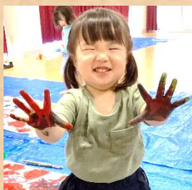
園内探検・ 在園児との交流